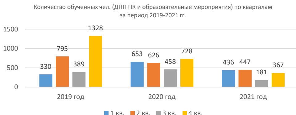
Рис. 1. Распределение количества слушателей по кварталам (2019–2021 гг.)

Распределение количества слушателей предоставлено на рисунке (2019–2021 гг.).